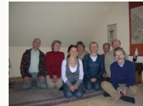
Noen av kurslederne ved IMA