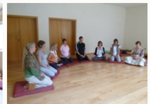
Øvelse i oppmerksomt nærvær