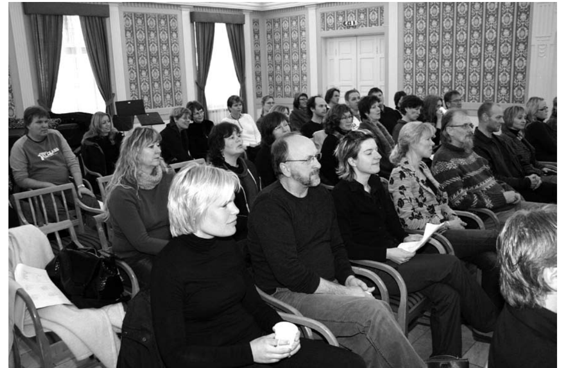
Tilfredse kursdeltakere fra Vestfoldklinikken.

sonalet. For å gjøre en lang historie kort så ble vi fort ganske sikre på at vi ønsket å satse på denne tilnærmingen.