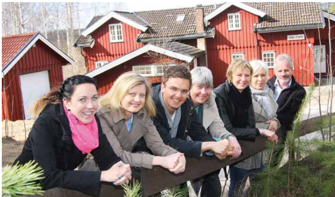
-Velkommen til oss i Villa Flora, sier teamet Rask psykisk helsehjelp